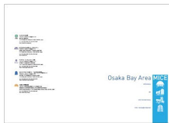
2018年版パンフレット